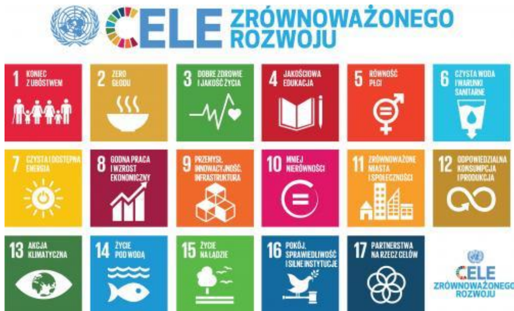
Rysunek 3. Cele zrównoważonego rozwoju 2016 - 2020

W 2015 roku światowi przywódcy przedstawili Cele Zrównoważonego Rozwoju (SDGs) i obiecali, że do 2030 roku zapewnią godziwą jakość nauki i możliwość uczenia się przez całe życie dla wszystkich.